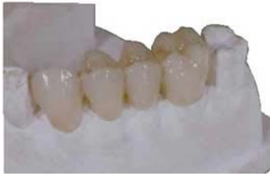
The.r.mo Bridge Prothese mit Innenfärbung und Transparenzzusatz