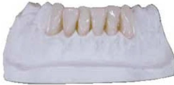
Brückenprovisorium mit Oberflächenfärbung